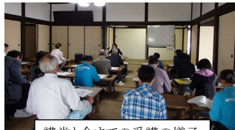
講堂と今までの受講の様子